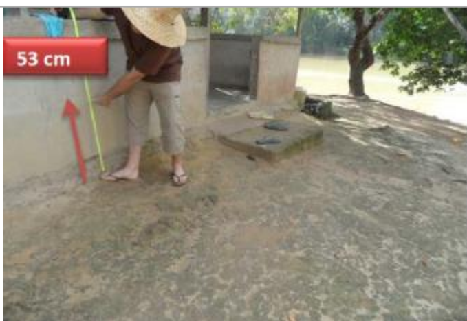
Vue du support et de la mesure du niveau des PHE