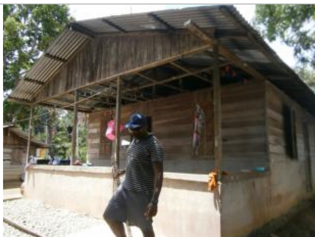
Vue du support de la mesure

Différence entre le niveau d'eau et la référence (en m) : 0.080 m