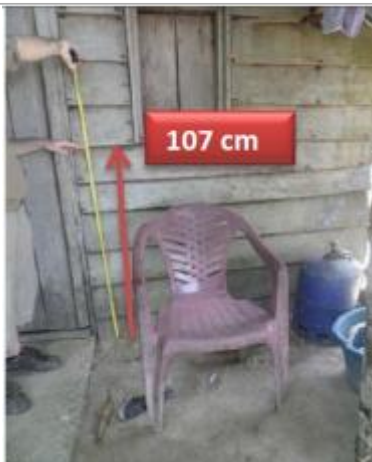
Vue du support et de la mesure du niveau des PHE