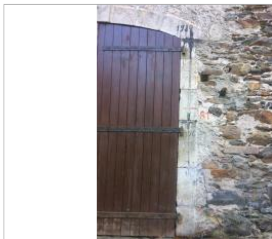
Vue des repères