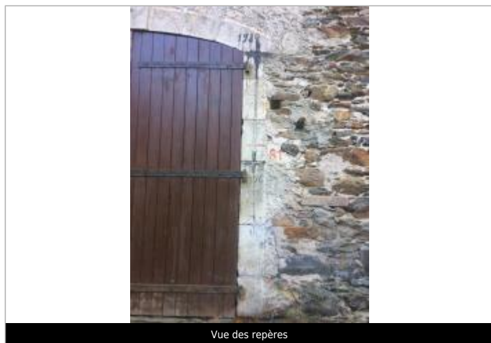
Vue des repères

Type de repérage : Autre Organisme(s) : SPC Garonne - Tarn - Lot