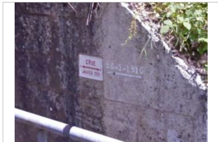
Vue des repères