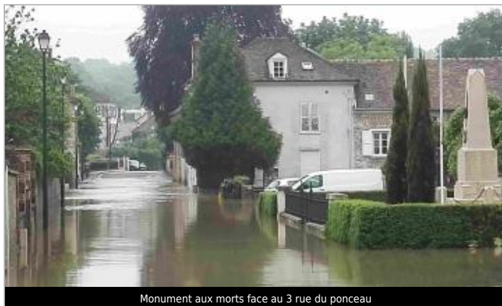
Monument aux morts face au 3 rue du ponceau