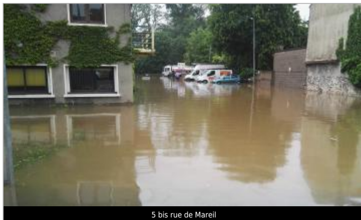
5 bis rue de Mareil

Coordonnées WGS84 : X: 1.85236733 / Y: 48.90763050