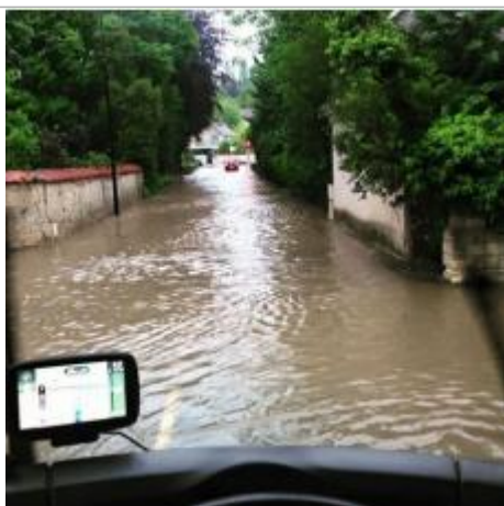
Route de montfort en direction du carrefour du cheval mort

Maximum de l'inondation : Non renseigné Visibilité : Non État du repère : Bon Pérennité : Aucune