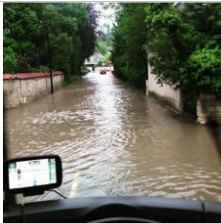
route de montfort en direction du carrefour du cheval mort