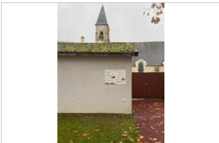
Repère de crue du 31 mai 2016 de l'Yvette à Saint Rémy lès Chevreuse