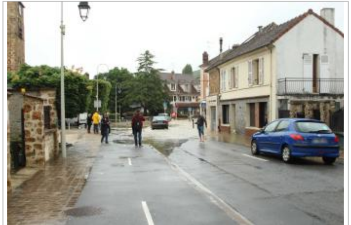
17 rue de la république