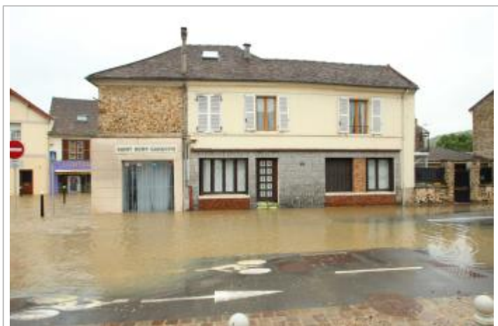
inondation par débordement 17 rue de la république

MARQUE Maximum de l'inondation : Non renseigné Visibilité : Oui État du repère : Bon Pérennité : Aucune