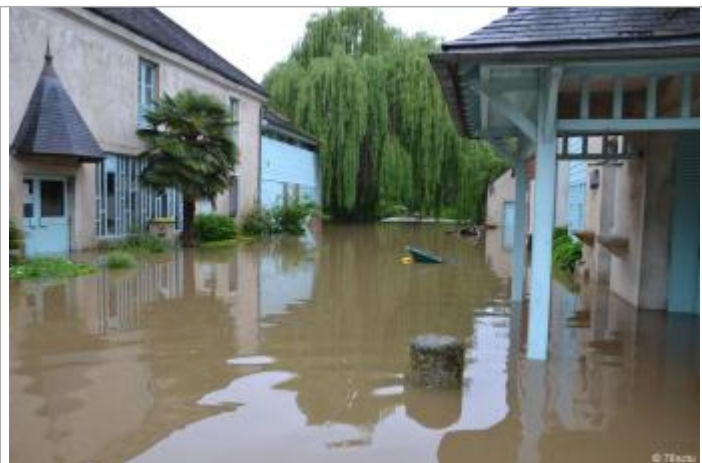
Maison des compagnons du devoir, moulin saint christophe