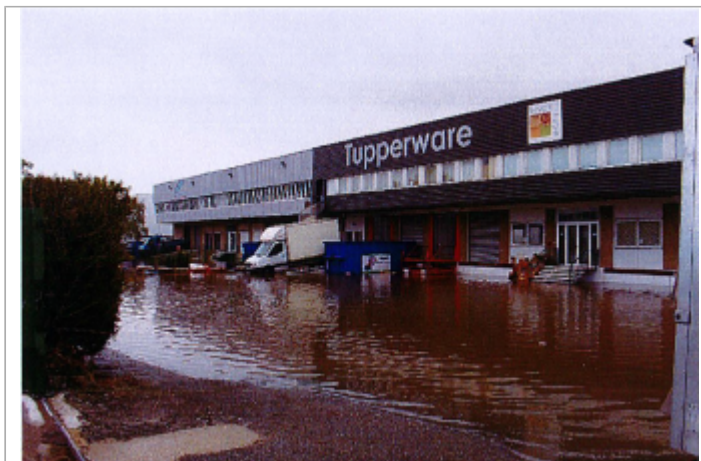
2 avenue du Patis