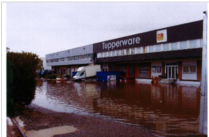
2 avenue du Patis