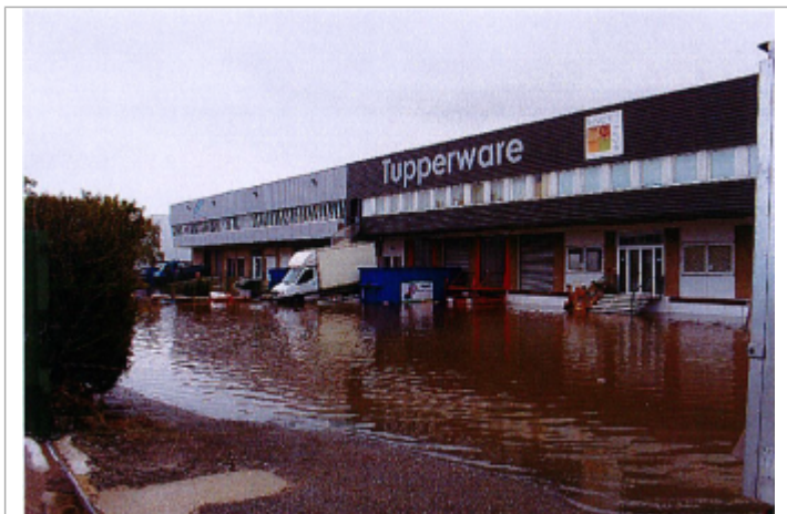
Inondation 2 avenue du Patis

Maximum de l'inondation : Non renseigné Visibilité : Oui État du repère : Bon Pérennité : Aucune