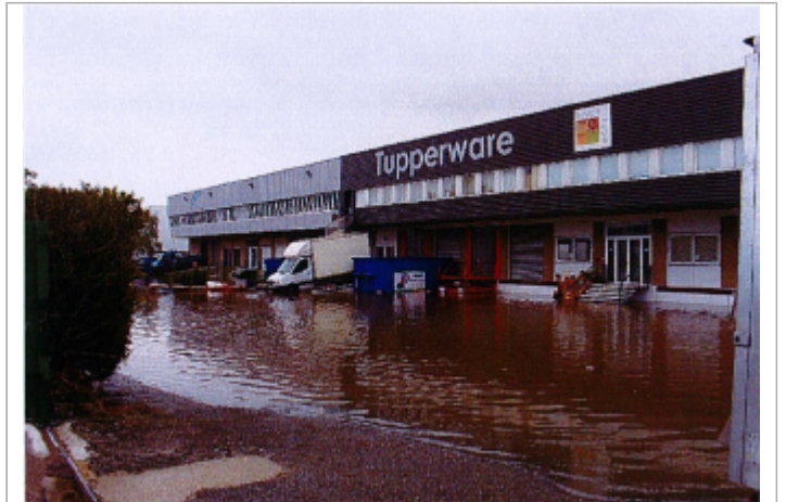
2 avenue du Patis