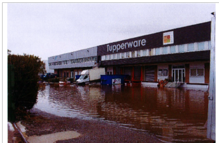
Inondation 2 avenue du Patis