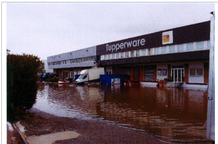
2 avenue du Patis