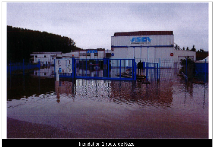
Inondation 1 route de Nezel

MARQUE Maximum de l'inondation : Non renseigné Visibilité : Non État du repère : Non renseigné Pérennité : Aucune