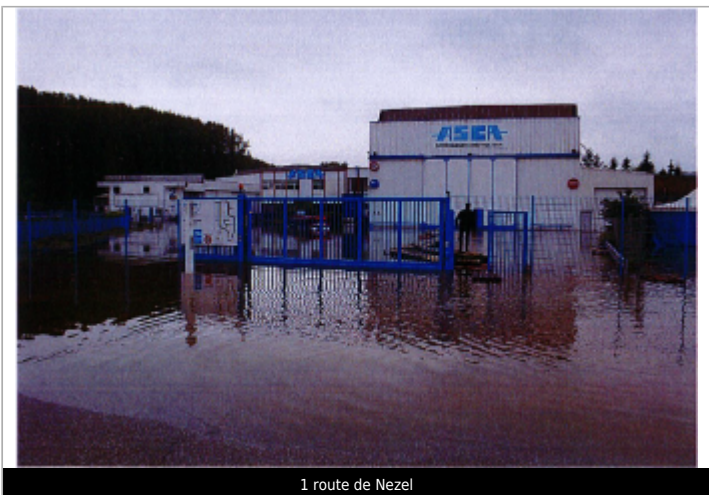
1 route de Nezel

GÉOLOCALISATION Coordonnées WGS84 : X: 1.82969410 / Y: 48.95726700 Coordonnées RGF93 (Lambert 93) X: 614299.32 / Y: 6873669.57 Coordonnées RGF93 (ETRS89) : X: 1.8296941 / Y: 48.957267 Code Hydro: H30-0400 Rive de référence: Droite