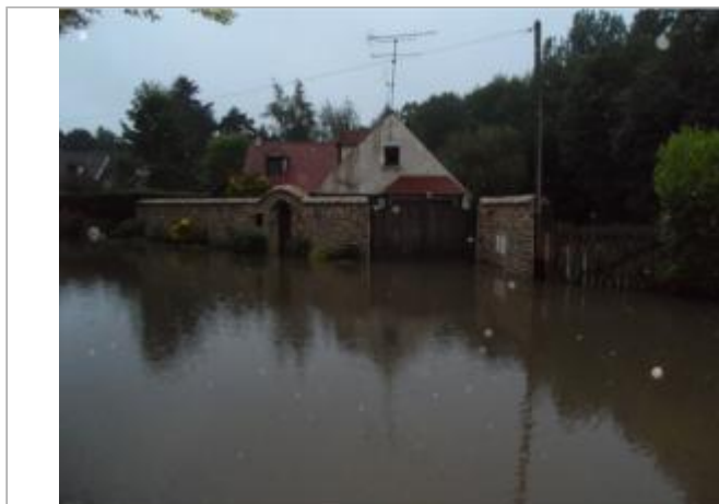
17 rue des vaux de cernay