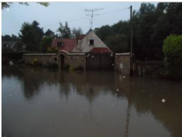
17 rue des vaux de cernay