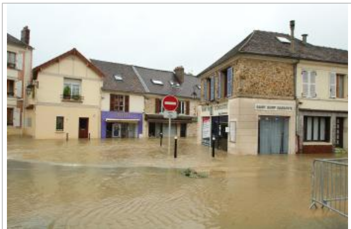
Laisse d'inondation sur les murs des bâtiments proche du 5 rue Chesneau

Maximum de l'inondation : Oui Visibilité : Oui État du repère : Bon Pérennité : Aucune