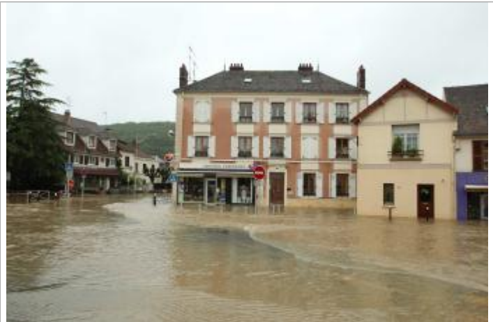
5 rue Pierre Chesneau