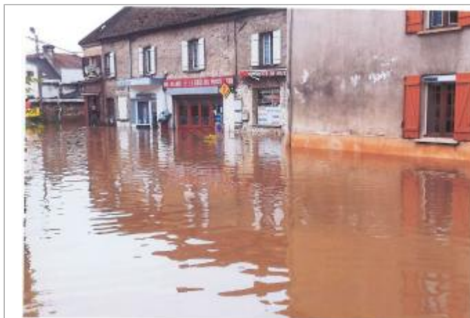
Numéros 20 pairs de la rue saint blaise