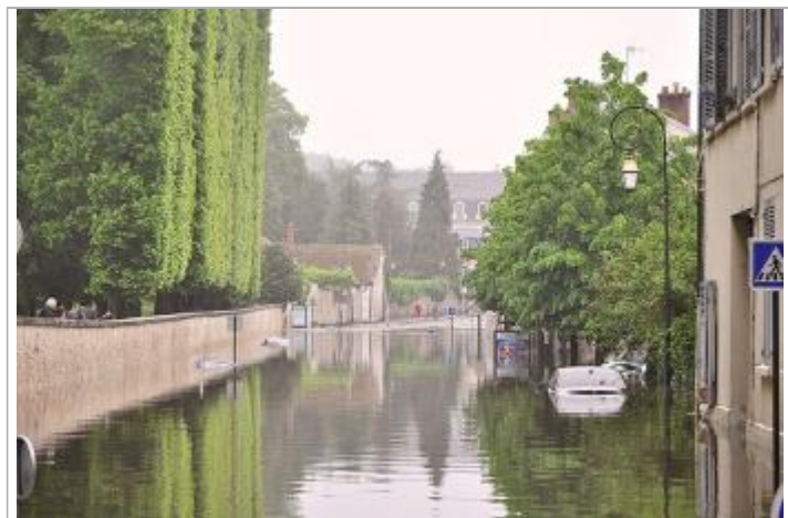
Laisse d'inondation sur le mur face au 18 rue de la motte