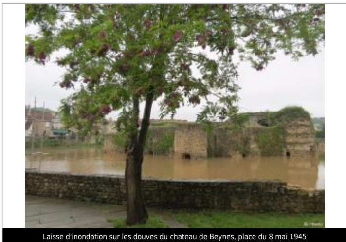
Laisse d'inondation sur les douves du chateau de Beynes, place du 8 mai 1945

Maximum de l'inondation : Oui Visibilité : Oui Pérennité : Aucune