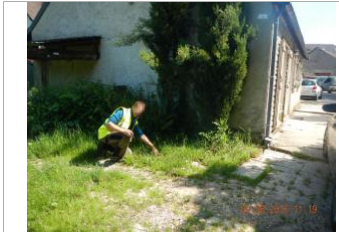
6 rue des fontaines

Coordonnées WGS84 : X: 1.86972000 / Y: 48.89348900