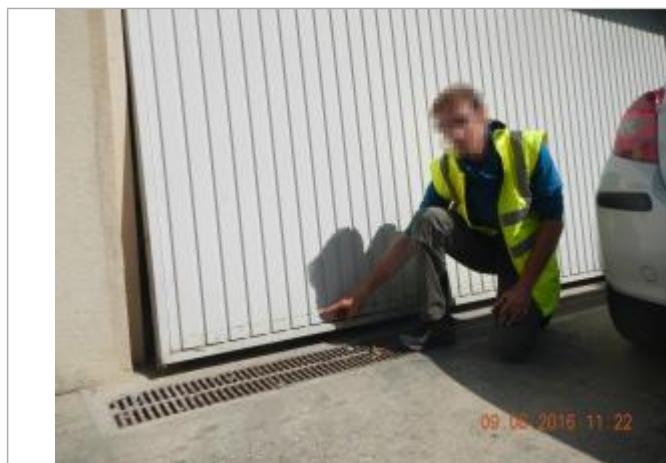
Ligne horizontale sur la porte du garage