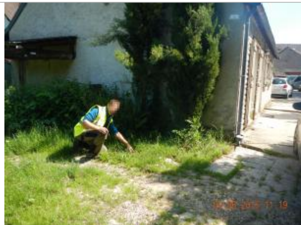
6 rue des fontaines