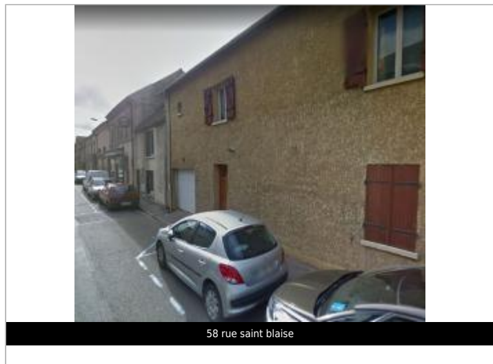
58 rue saint blaise