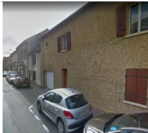
58 rue saint blaise