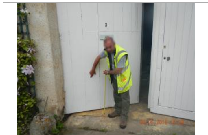
Trace horizontale laissée par la crue sur la porte du garage

MARQUE Maximum de l'inondation : Oui Visibilité : Oui État du repère : Bon Pérennité : Aucune