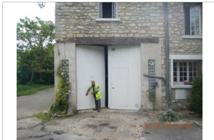
3 ruelle du colombier

GÉOLOCALISATION Coordonnées WGS84 : X: 1.83537100 / Y: 48.94272400 Coordonnées RGF93 (Lambert 93) X: 614691.16 / Y: 6872046.35 Coordonnées RGF93 (ETRS89) : X: 1.835371 / Y: 48.942724 Code Hydro: H30-0400 Rive de référence: Droite