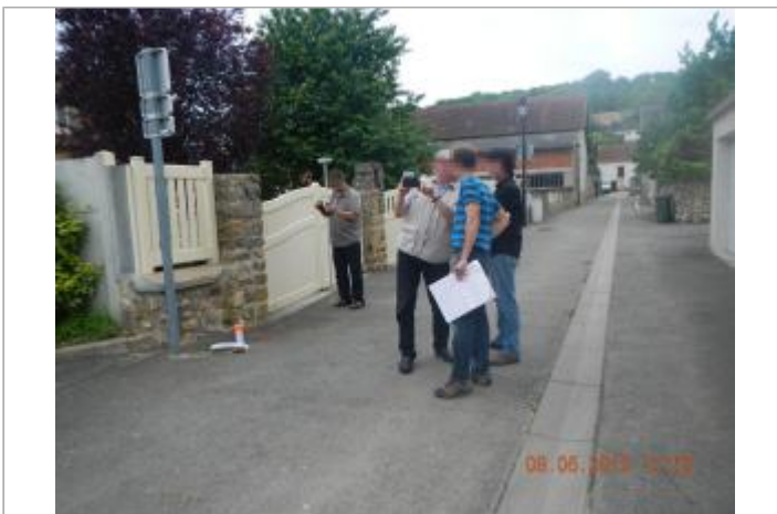
4 ruelle du petit moulin