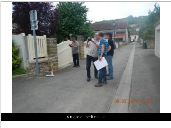
4 ruelle du petit moulin