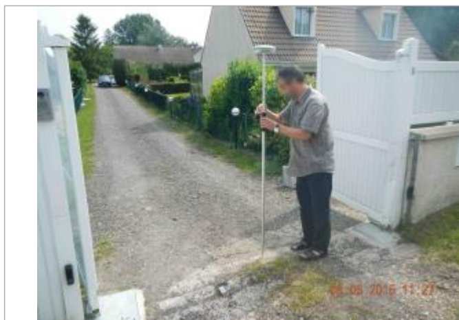
Limite maximale de la zone inondée au niveau du seuil du portail