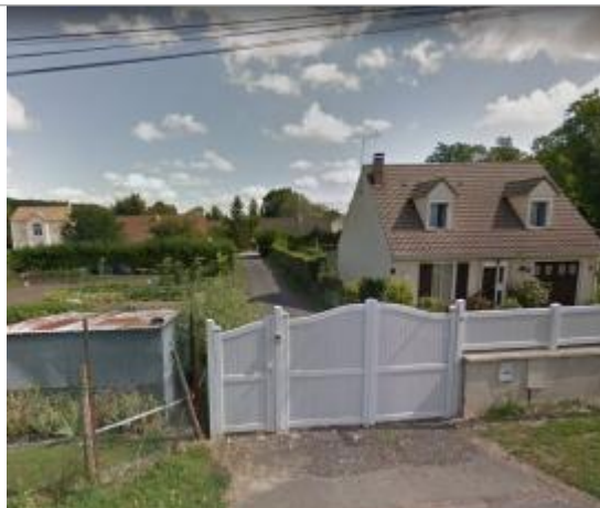
5 chemin des coyards

Coordonnées WGS84 : X: 1.82488130 / Y: 48.95542000