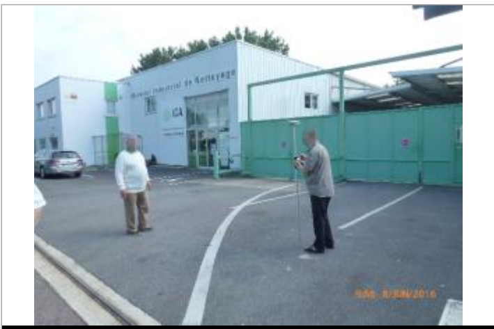
Cour avant du 346 avenue de la Couronne des prés

GÉOLOCALISATION Coordonnées WGS84 : X: 1.82288910 / Y: 48.96127300 Coordonnées RGF93 (Lambert 93) X: 613807.68 / Y: 6874122.42 Coordonnées RGF93 (ETRS89) : X: 1.8228891 / Y: 48.961273 Code Hydro: H30-0400 Rive de référence: