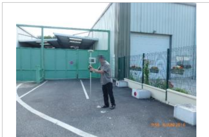
Mesure cour avant (côté avenue), en limite de zone inondable

Maximum de l'inondation : Oui Visibilité : Non État du repère : Bon Pérennité : Aucune