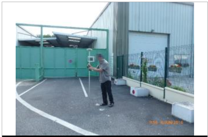
Mesure cour avant (côté avenue), en limite de zone inondable

MARQUE Maximum de l'inondation : Oui Visibilité : Non État du repère : Bon Pérennité : Aucune