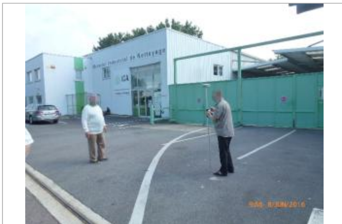
Cour avant du 346 avenue de la Couronne des prés