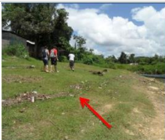
Vue du support et de la mesure du niveau des PHE