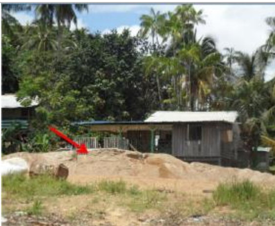
Vue du support et de la mesure du niveau des PHE

Différence entre le niveau d'eau et la référence (en m) : 0.000 m