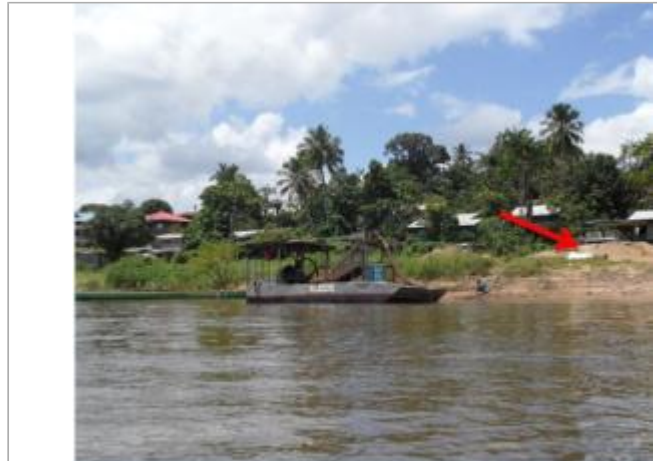
Vue globale du bâtiment

Coordonnées WGS84 : X: -54.02780214 / Y: 3.64380425