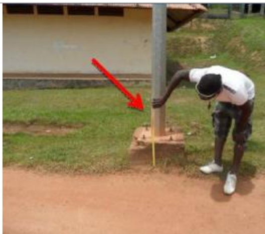
Vue du support et de la mesure du niveau des PHE