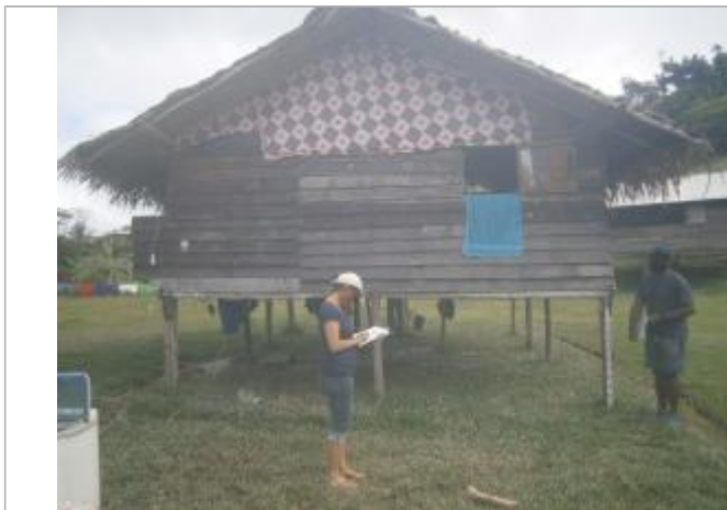
Vue du support de la mesure

Différence entre le niveau d'eau et la référence (en m) : 0.930 m