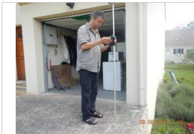
Mesure effectuée devant le garage puis collection avec marque à l'intérieur