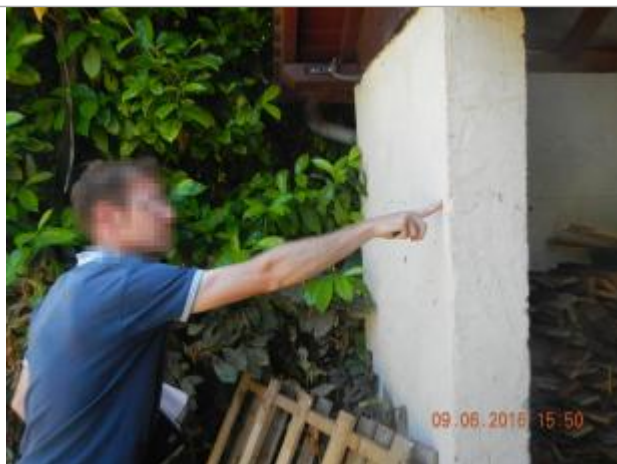
Ligne horizontale sur l'abri à l'arrière de la maison