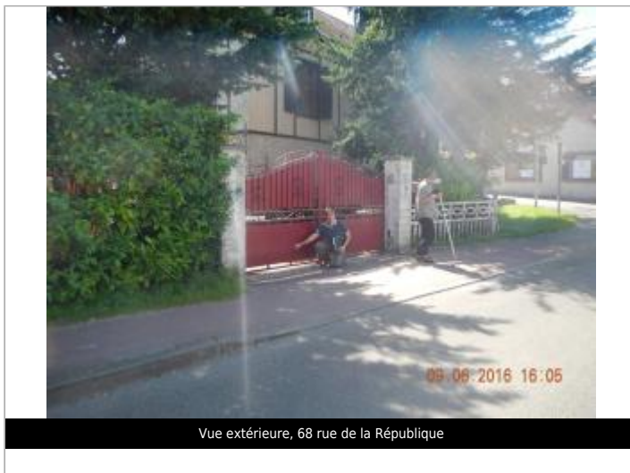
Vue extérieure, 68 rue de la République