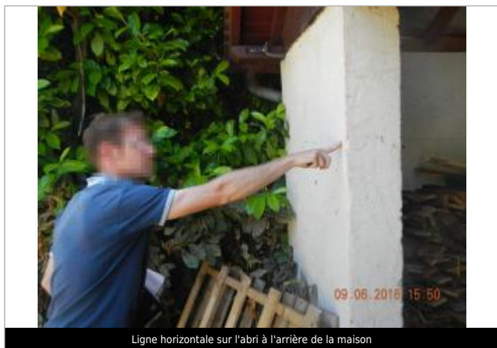
Ligne horizontale sur l'abri à l'arrière de la maison

Maximum de l'inondation : Oui Visibilité : Oui État du repère : Bon Pérennité : Aucune