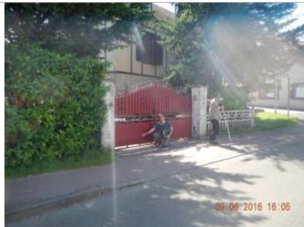
Vue extérieure, 68 rue de la République

Coordonnées WGS84 : X: 1.87601070 / Y: 48.85254700