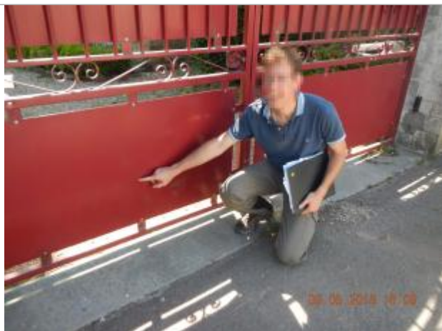
Ligne horizontale laissée par la crue sur le portail d'entrée de la propriété