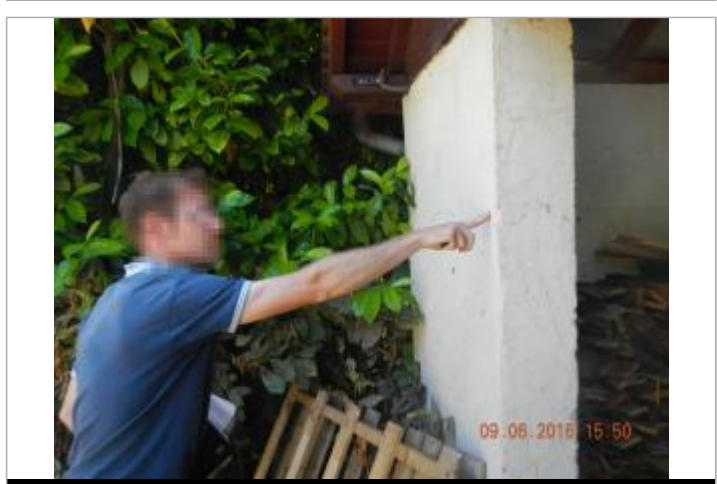
Ligne horizontale sur l'abri à l'arrière de la maison

Maximum de l'inondation : Oui Visibilité : Oui État du repère : Bon Pérennité : Aucune