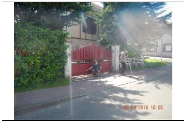
Vue extérieure, 68 rue de la République