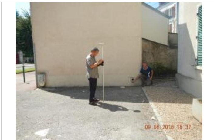
113 rue de la République