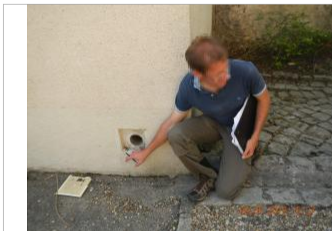
Niveau maximum atteint sous la bouche d'aération du côté du magasin