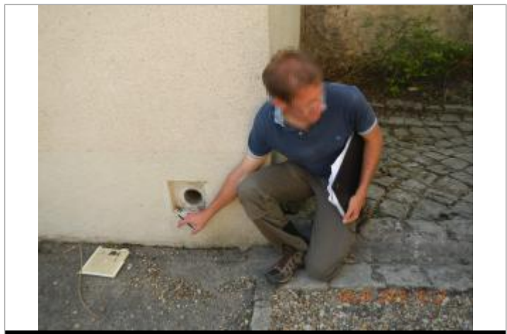
Niveau maximum atteint sous la bouche d'aération du côté du magasin

MARQUE Maximum de l'inondation : Oui Visibilité : Oui État du repère : Bon Pérennité : Aucune