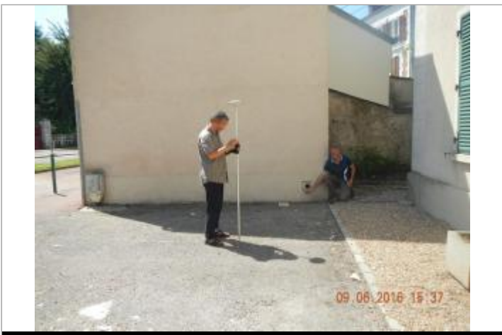
113 rue de la République

GÉOLOCALISATION Coordonnées WGS84 : X: 1.87650277 / Y: 48.85287040 Coordonnées RGF93 (Lambert 93) X: 617561.68 / Y: 6862012.06 Coordonnées RGF93 (ETRS89) : X: 1.8765028 / Y: 48.8528704 Code Hydro: H3052000 Rive de référence: Gauche