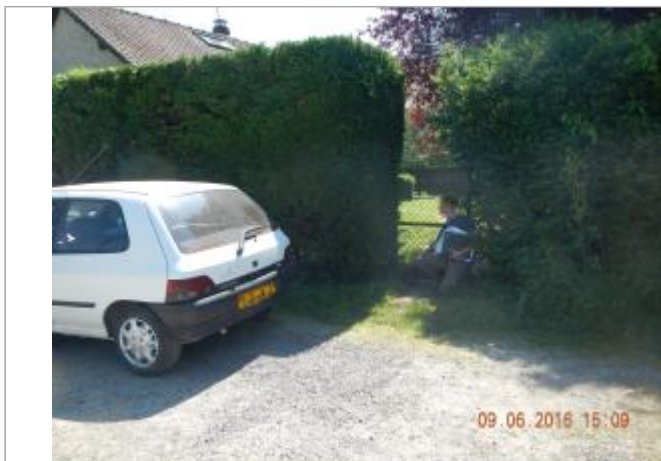
portillon d'entrée de la propriété