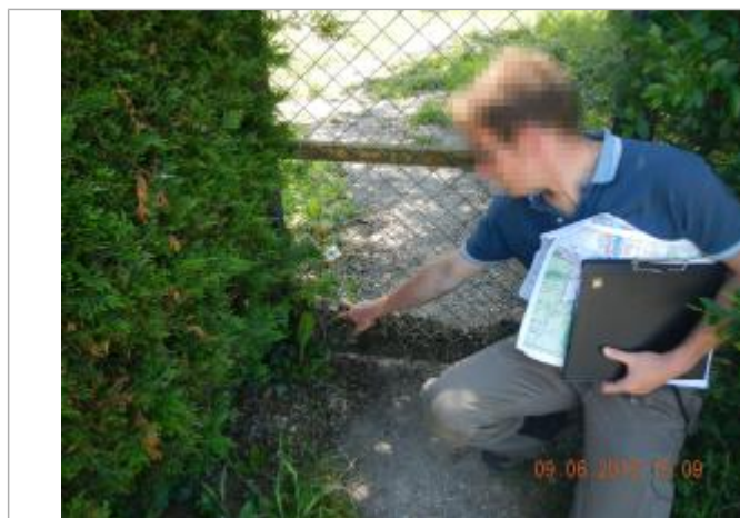
Laisse de branches et feuilles sur le portillon