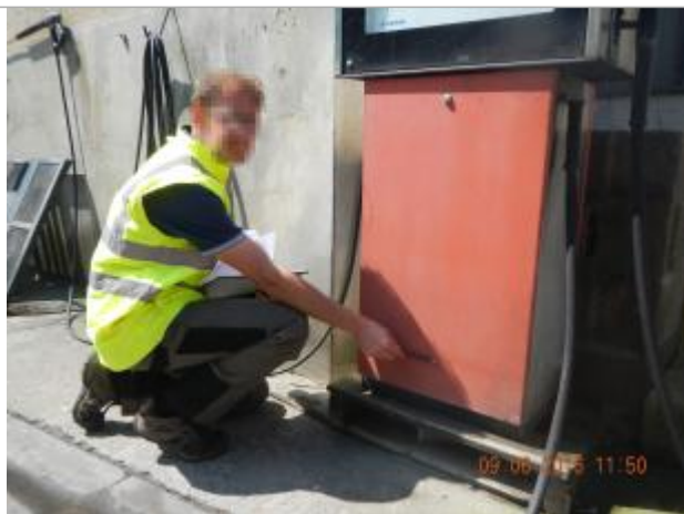
Ligne horizontale laissée par la crue sur une pompe à l'arrière du bâtiment