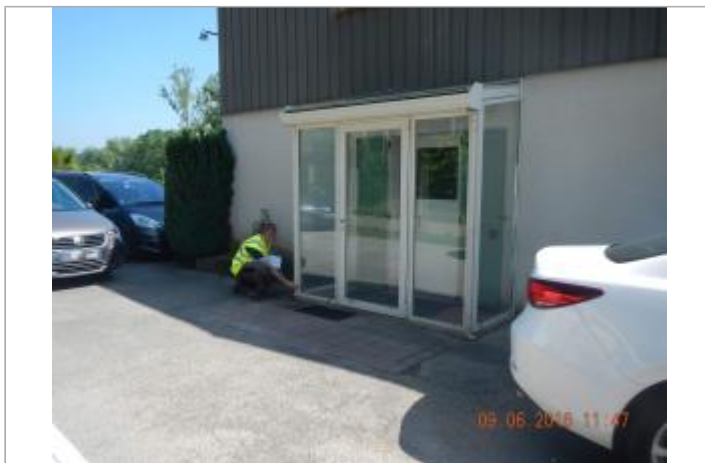
Vitrine de l'Entreprise, lieu dit La croix Surgis