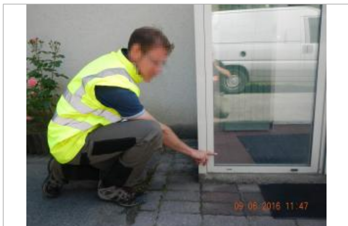
Ligne horizontale laissée par la crue sur la vitre de la porte d'entrée