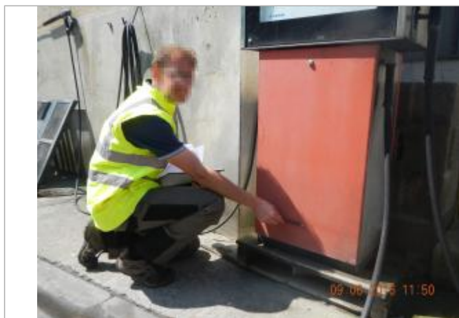
Ligne horizontale laissée par la crue sur une pompe à l'arrière du bâtiment