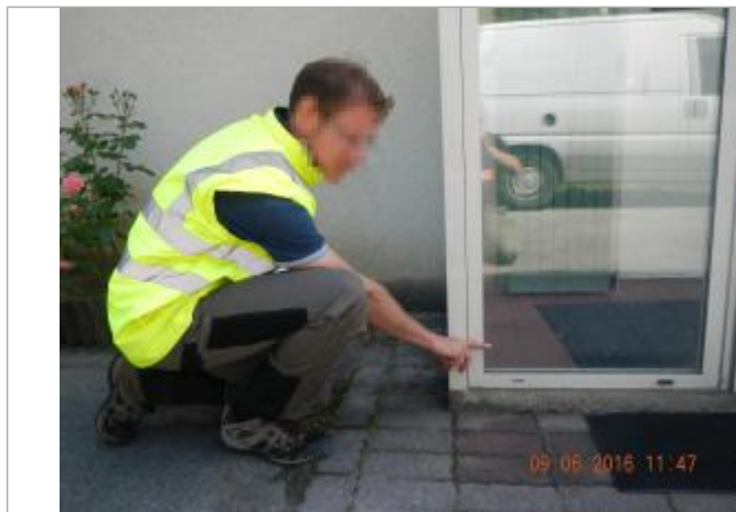
Ligne horizontale laissée par la crue sur la vitre de la porte d'entrée