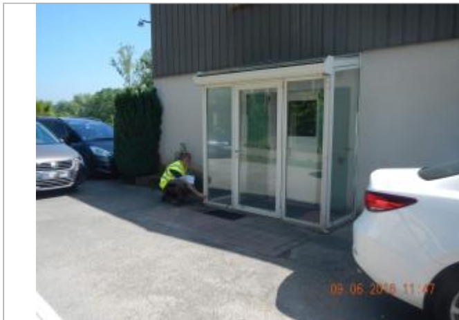
Vitrine de l'Entreprise, lieu dit La croix Surgis