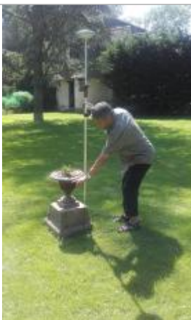
Niveau d'eau juste sous le rebord de la partie haute de la vasque