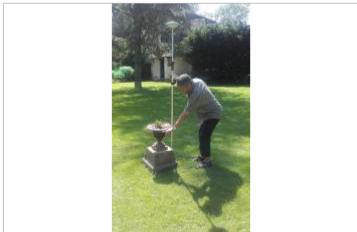
Niveau d'eau juste sous le rebord de la partie haute de la vasque