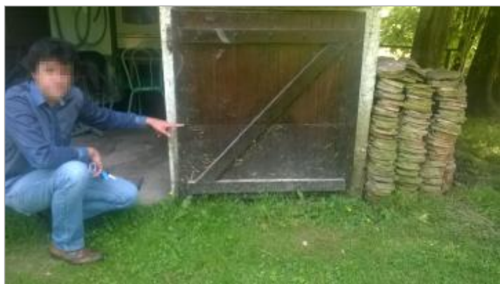
Ligne horizontale laissée par la crue sur une porte de box