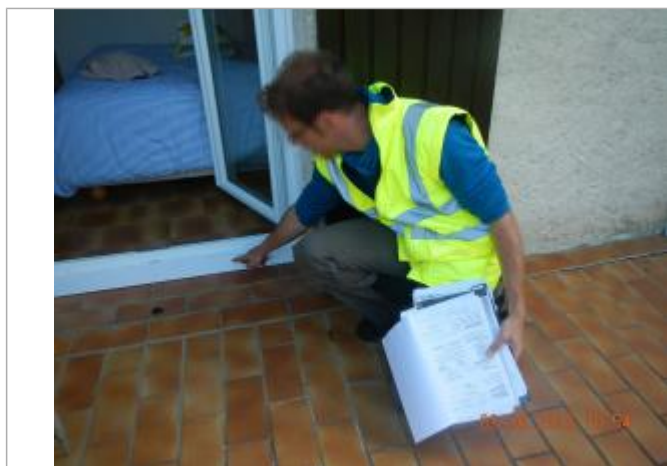
Limite basse de la baie vitrée