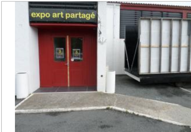
Macaron Xynthia sur mur