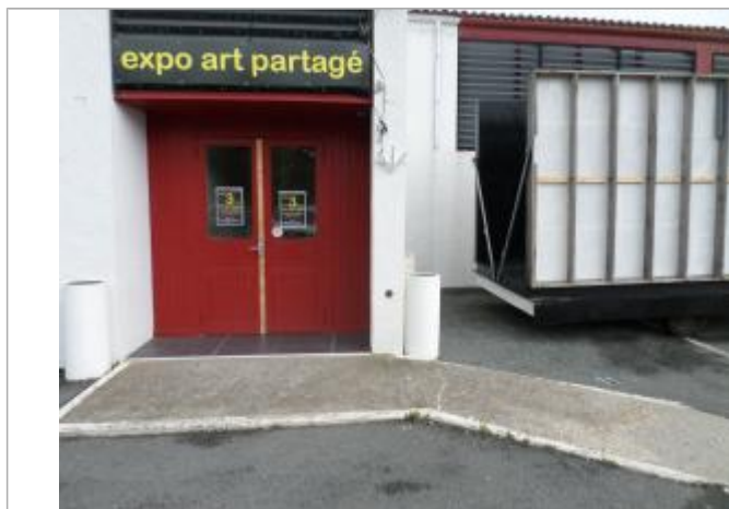
Macaron Xynthia sur mur

SOURCE DE REPÉRAGE : RECENSEMENT DE LA CDC ILE D'OLÉRON - 01/06/2016