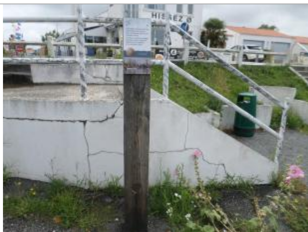
Totem bois avec coiffe et macaron

Altitude calculée de l'eau (en m) : 3.58 m