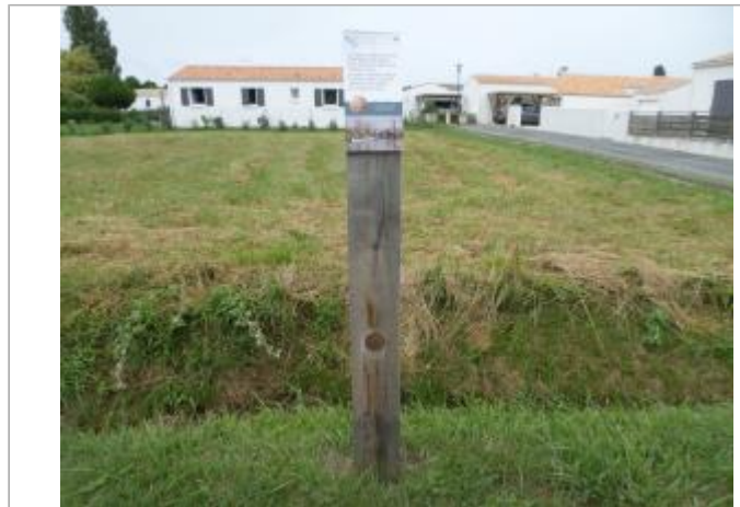
Totem bois avec coiffe et macaron